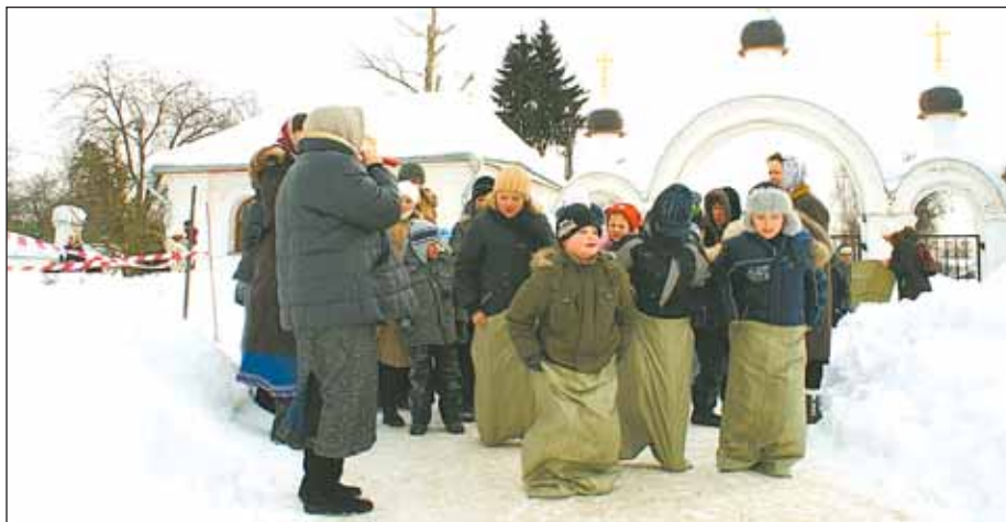
Полосу подготовила Екатерина КАПРАЛОВА, фото и информация предоставлены благочинием

Мороз не помешал ребятам принять участие в спортивных конкурсах, организованных преподавателями. Бег в мешках, перетягивание каната и другие состязания развлекли щёки и подняли настроение всем участникам и зрителям. Детям - веселье, родителям – радость! С Масленицей!