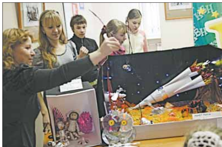
Кукольная постановка «Спасение марсиан»