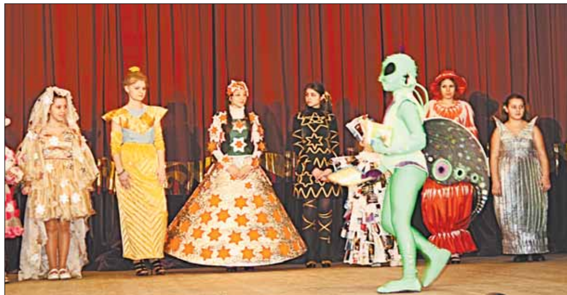
Шоу костюмов инопланетян

ся группой «Дружные волшебники» школы №2 города Истры. В полной драматизма постановке – эпизод на Марсе, в котором злой монстр пожирает незадачливых местных жителей и держит всех в страхе, но прибывший в ракете землянин в неравной схватке побеждает коварное чудовище, и мир и ликование воцаряются на планете. И герои, и сама планета сдела-