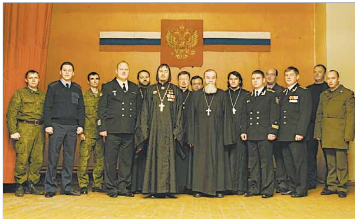
Полосу подготовила Екатерина КАПРАЛОВА, информация и фотографии предоставлены БЛАГОЧИННИЕМ

церкви в Константинополе в середине X века, свидетелем которого был святой Андрей: он увидел идущую по воздуху Пресвятую Богородицу, которая сняла со Своей головы покрывало и распростерла его над молившими в храме людьми. В беседе батюшка рассказал о житии Святого Андрея, о вере Христовой, ответил на вопросы. В завершении встречи участники мероприятия высказали друг другу взаимные добрые пожелания о дальнейшем сотрудничестве.