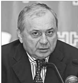
На вопросы нашего издания отвечает председатель Комитета Государственной Думы по строительству и земельным отношениям Мартин Шаккум.

- Можно ли говорить, что на данный момент кризис для строительной отрасли закончился?