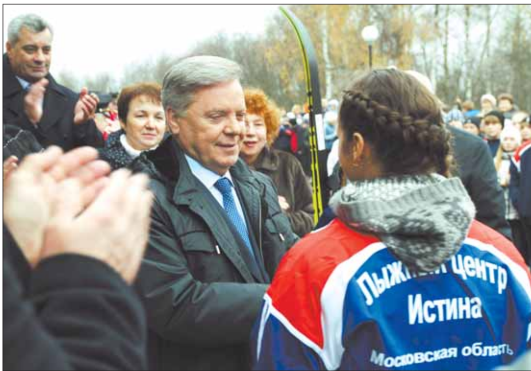
Ученики лыжного центра вручают губернатору Борису Громову символический подарок - комплект лыж

– Лыжный центр «Истина» – лучший не только в вашем районе, но и в Московской области и даже во всей России, – сказал губернатор. – Здесь с детства работают профессионалы, тренеры высокого уровня. Большое спасибо всем, кто принимал участие в возведении этого здания. Воспитанникам школы я желаю крепкого здоровья и новых успехов, ведь Олимпийские игры не за горами. А тренерам – успешной и плодотворной работы в деле воспитания чемпионов.