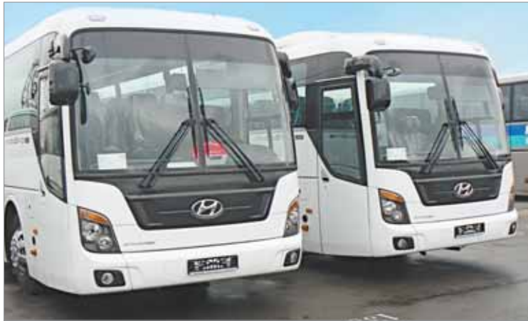
Новеньким автобусам марки «Хёндай» скоро присвоят госномера