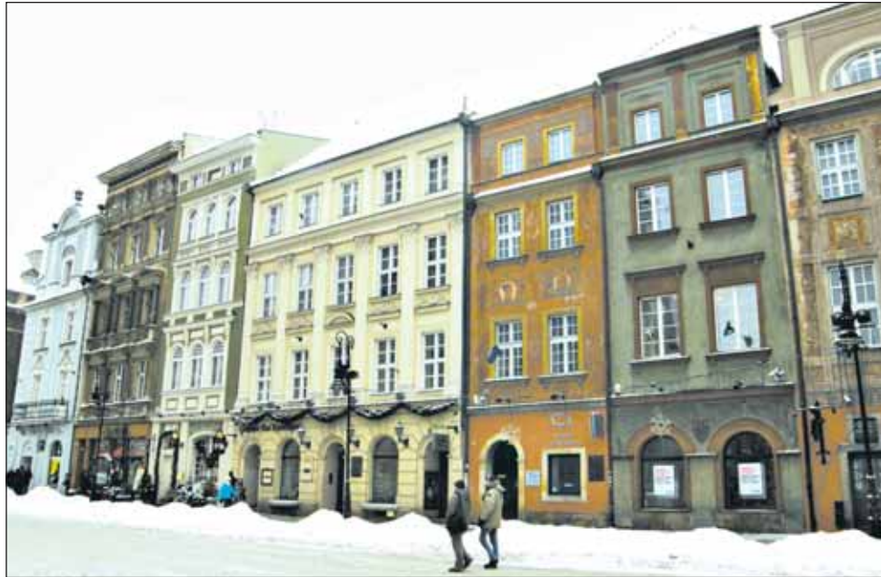
На улицах городов

Как потом оказалось, полнейший форс-мажор. Поляки – чтобы туристы не застревали на границе с Белоруссией между Брестом и Тересполом – перевозят людей не на автобусах, а на электричке. Молодцы. Это новшество позволяет преодолеть границу без помех, поезд идет жёстко по расписанию, опоздание исключено (когда-то мне пришлось стоять на польской границе в туристическом автобусе: это был ад, стояли сутки, и нам говорили, что это ещё пустяки). Но именно в тот злополучный день железнодорожные пути так занесло снегом, что специальная техника еле справлялась с завалами, и поезд просто ждал,