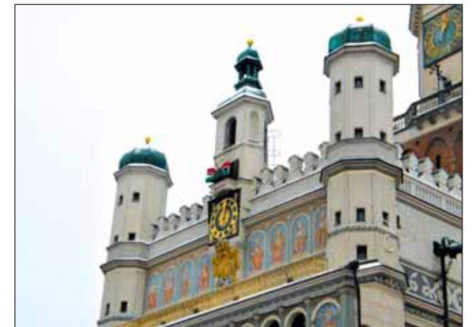
Знаменитая ратуша в Познани с козликами

всем там понравилось! Увидели Тумский остров с готическими сооружениями: Кафедральный собор с усыпальницей первых польских королей династии Пястов, костёл Пресвятой Девы Марии. Успели полюбоваться Познаньской ратушей на Старогородской площади, выстроенной в эпохе