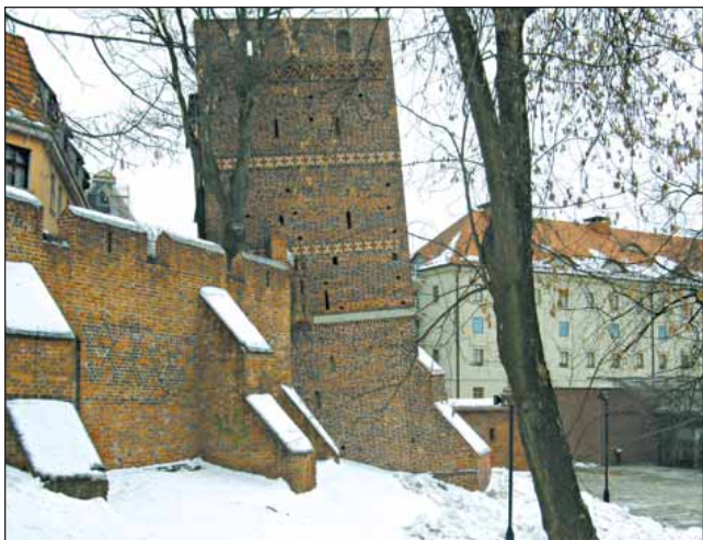
Падающая башня в Торуне

Но Сильвестр – разговор отдельный. Опять же «пшекам» респект: постарались, устроили нам замечательный праздник, оказали, как говорится, уважение. Развлекали нас, удивляли, устроили фейерверк: приглашённые артисты душевно исполняли хиты, как мировой, так и российской эстрады: включили на большой плазме обращение Дмитрия Медведева (наш новый год случился на два часа раньше Сильвестра) – было приятно и хорошо, как дома. Я подсознательно всё ждала проявления той самой недоброежелательности, антирусских настроений. Знаете, я много где была и в Восточной и в Западной Европе, и в Штатах, и в арабских странах, и в Азии... Но вот недоброежелательности нигде так и не встретила! Даже в пресловутой Прибалтике. Наверное, всё банально: если не демонстрируешь великодер-