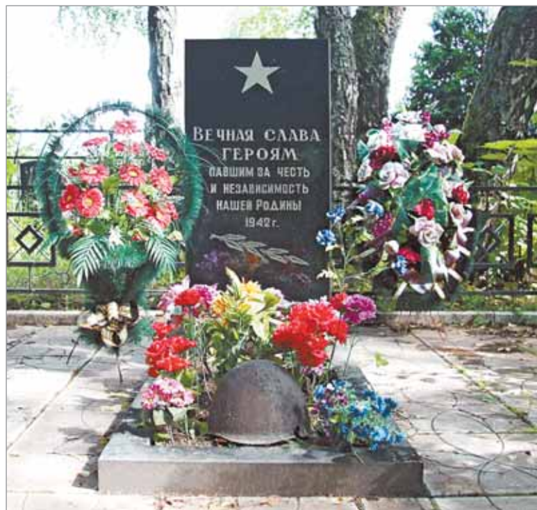
Памятник павшим воинам в Садках

Во время Великой Отечественной войны в нашем районе дислоцировалось 24 госпиталя. В городе