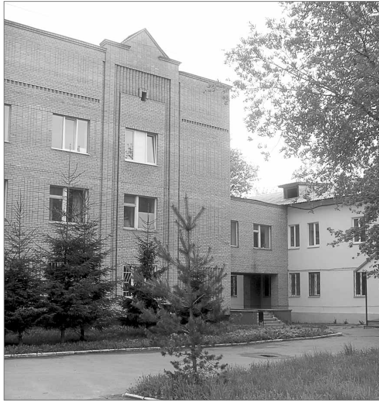
Недалеко от крыльца Новопетровской больницы «друзья» оставили мальчика умирать

Бледность или покраснение лица, землистый цвет кожи, расширенные или суженные зрачки, не реагирующие на свет, «стеклянный» взгляд, чрезмерная раздражительность или, наоборот, безмерная веселость... Резкие, беспричинные перепады настроения, подавленность, повышенная возбудимость или безучастное поведение, потеря интереса к окружающему миру, потоотделение со специфическим резким запахом, озноб, бессонница, полная потеря аппетита или сильное его повышение, несвяз-