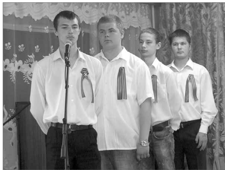
9 МАЯ. А на сцене - трудовые резервы ПСО-13, каменщики-электрогазосварщики группы МК-08!

ную практику и в июне получите хорошую аттестацию!