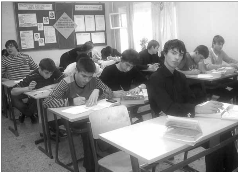
Оканчивая училище, ребята одновременно получают среднее образование. Выпускное сочинение по литературе в группе МК-08. Нам многое скажут заданные темы. Полководческий дар Кутузова и его человеческая доброта в романе Л.Н.Толстого «Война и мир». Тема любви и дружбы в русской лирике 19 века. Сатира в творчестве М.Е. Щедрина. Изображение деревни в русской литературе XX века. Великая Отечественная война 1941 - 1945 гг. в русской литературе.

Избранные страницы праздника «Последний звонок-2011» в профессиональном училище №65 дадут читателю представление о жизни, скрытой за стенами училища.