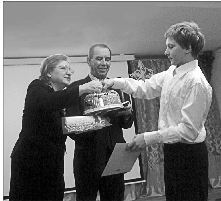
Первое участие в конкурсе на лучшее исполнение патриотической песни поощряется...-сами видите - ТОРТОМ!

- Дорогие коллеги, дорогие ребята, уважаемые гости нашего праздника! У нас снова волнующий день! Мы еще все вместе, но уже в мае многие из наших учеников наденут военную форму. Годы учебы позади. Я очень рад, что в стенах нашего училища вы получили полное среднее образование; это - основа, это база. Закончено и теоретическое изучение профессии, давайте аплодисментами поблагодарим ваших мастеров и ваших преподавателей! Мы надеемся, что вы успешно пройдете производствен-