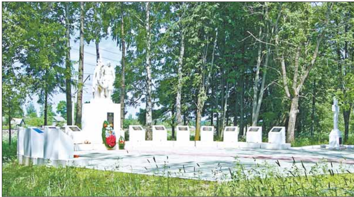
Памятник погибшим партизанам в с. Новопетровское.

Ощутимые удары по врагу наносили партизаны бывшего