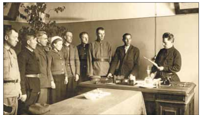
Партизаны принимают присягу.