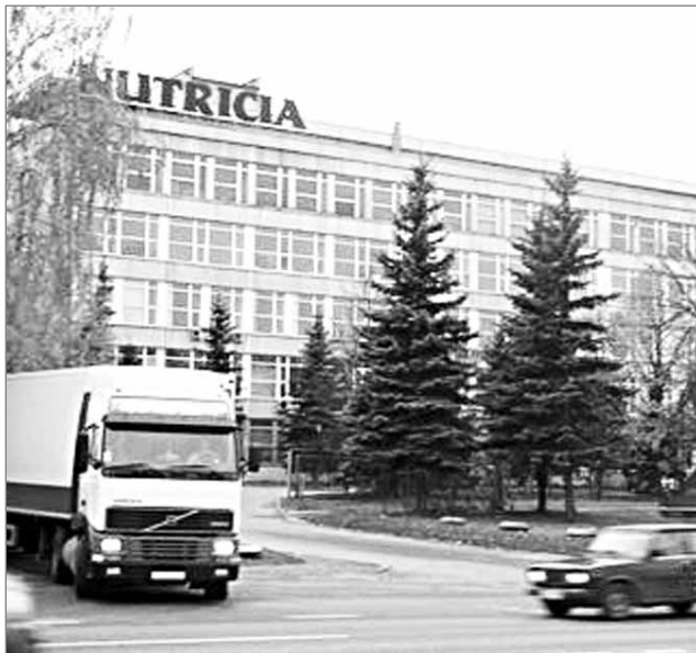
Компания «Детское питание Истра-Нутриция» успешно работает на рынке детских товаров с 1995 г. Одно из лучших производств Московской области