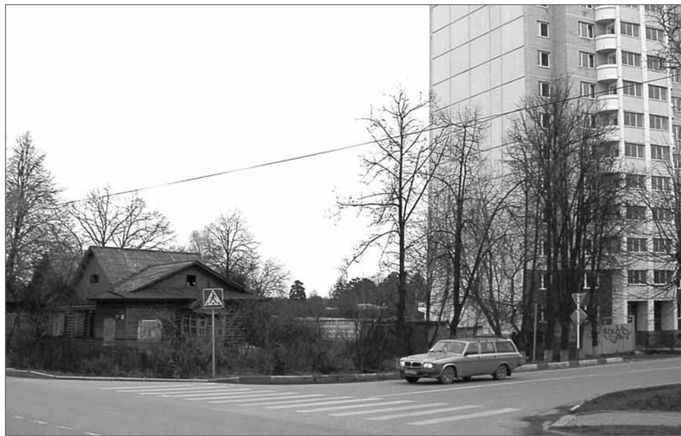
На месте бараков вырастут новостройки

- Есть утвержденный проект благоустройства территории вокруг пруда. Пока выполнены первоочередные мероприятия: пруд полностью был вычищен