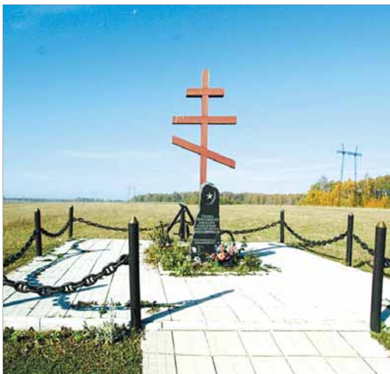
Памятный знак на рождественском поле

В ночь на 27 ноября разгрузились на станции Павшино, в 26 км от Москвы. Сосредоточились в районе Нахабино. В первые дни бригада была подчинена начальнику обороны Москвы, который дал распоряжение выделить 9-й гвардейской стрелковой дивизии 200-250 человек, установить связь с командиром этой дивизии, а бригаду вывести в район Дедовска. Утром 29 ноября разыскал штаб 9-й гвардейской дивизии. Встретились с командиром Белобородовым. Он предложил срочно один батальон вывести на Волоколамское шоссе и оседлать дорогу, т.к. по его предположению противник в этом направлении должен начать наступление. Третий батальон получил приказ выйти на шоссе и оборудовать огневые позиции. Батальону были приданы: одна батарея 76 мм и четыре пушки 43 мм и один взвод противотанковых ружей. Батальон в указанном районе нашел готовые окопы, но выполнены они были по типу 1916-1917 гг. Бойцы сразу же начали их переоборудовать. Боевое крещение – 30 ноября, когда немцы из пехотного полка с 19 танками, после сильного артобстрела перешли в наступление. В результате трехчасового боя противник был отбит, но наши потери были очень большими. 120 человек было убито, 160 – ранено. Были убиты два командира рот.