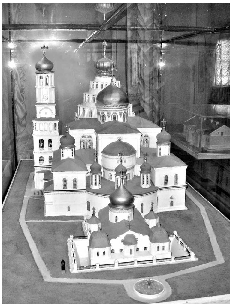
Это макет Воскресенского Новоиерусалимского храма с восстановленной колокольней

- Безусловно, и на наших плечах очень большая ответственность. Кстати, недавно побывали на юбилее Звенигородского музея, ведь многие подмосковные музеи – наш, Звенигородский, Сергиево-Посадский, Серпуховской, Музей «Мураново» были образованы примерно в одно время, в 1920-м году ушедшего столетия. Это были сложные годы в истории нашей страны, и государство создавало музеи с целью сохранить богатое культурное наследие не только дворянских усадеб, но храмов и монастырей. Волею судеб наш музей оказался в стенах известной обители Новый Иерусалим. Музей стал собирателем многих культурных ценностей в то время. Он страшно пострадал в 1941 году при гитлеровском нашествии, часть художественных и исторических коллекций была утрачена, но в послевоенные годы поколения сотрудников и реставраторов восполнили эти коллекции, возродили из