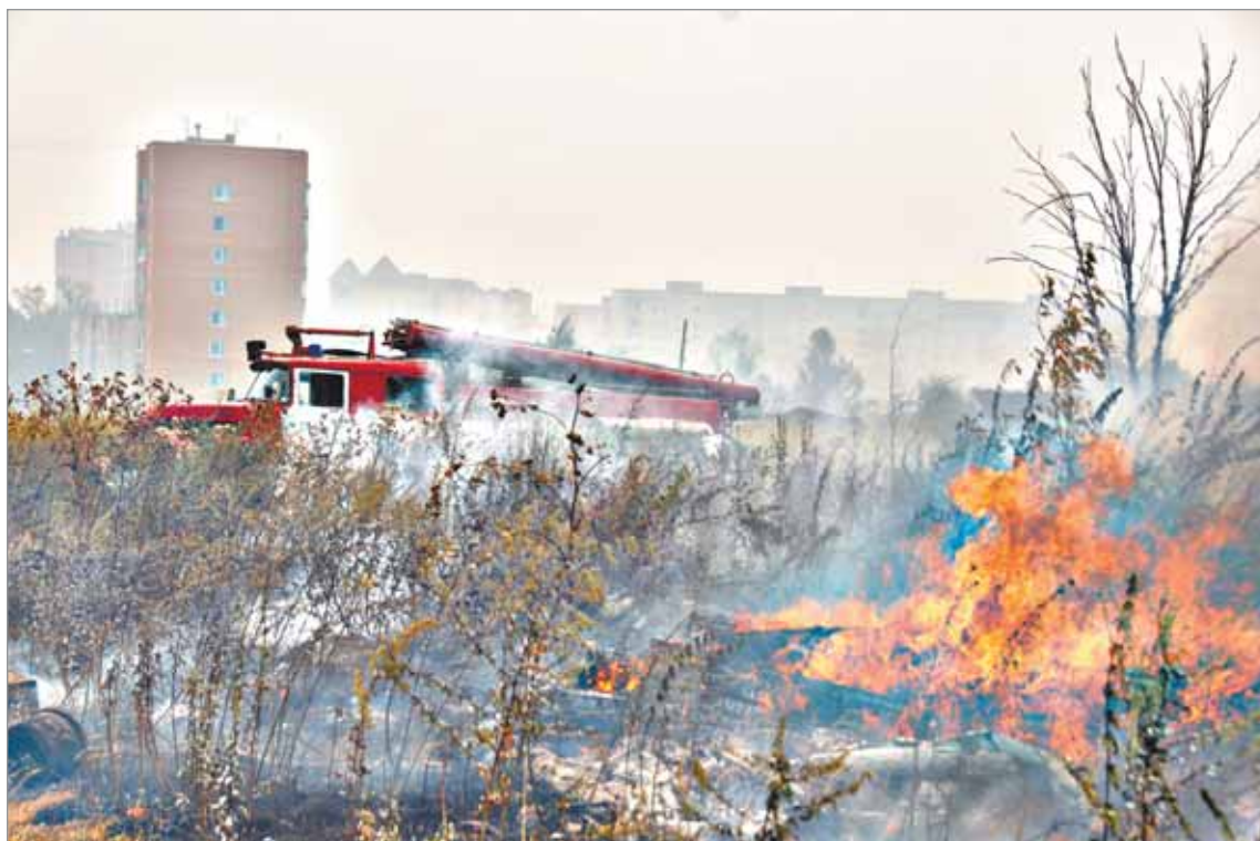
Огонь в «Большевике» удалось быстро загасить