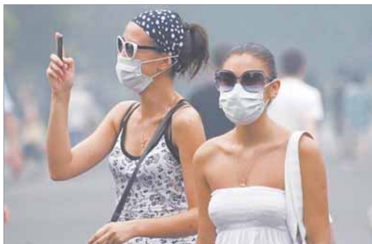
Люди в масках на улицах подмосковных городов