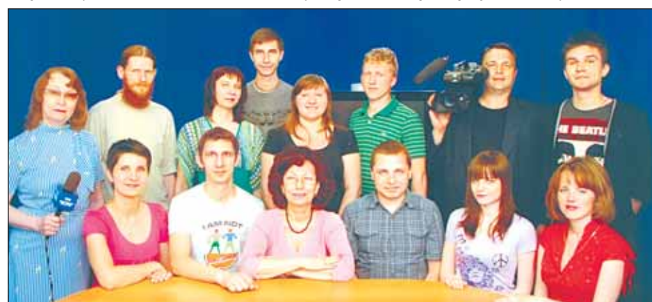
Муниципальное бюджетное учреждение «Телерадиокомпания «Истра» (главный редактор Гумерова-Капралова С.Л.)