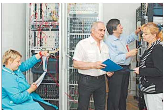
Территориальное управление №3 центрального филиала ОАО «Ростелеком»