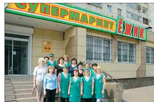
ООО «БИК-2002» - торговое предприятие, городское поселение Дедовск