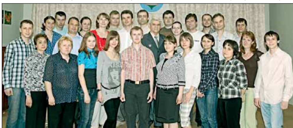
Истринская районная молодёжная организация «Клуб ИСТОК»