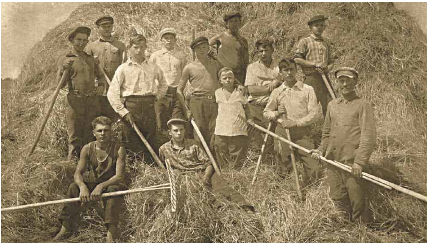
Запечатлённые на снимке молодые люди до войны трудились в колхозе. Почти все они ушли на фронт и погибли в боях