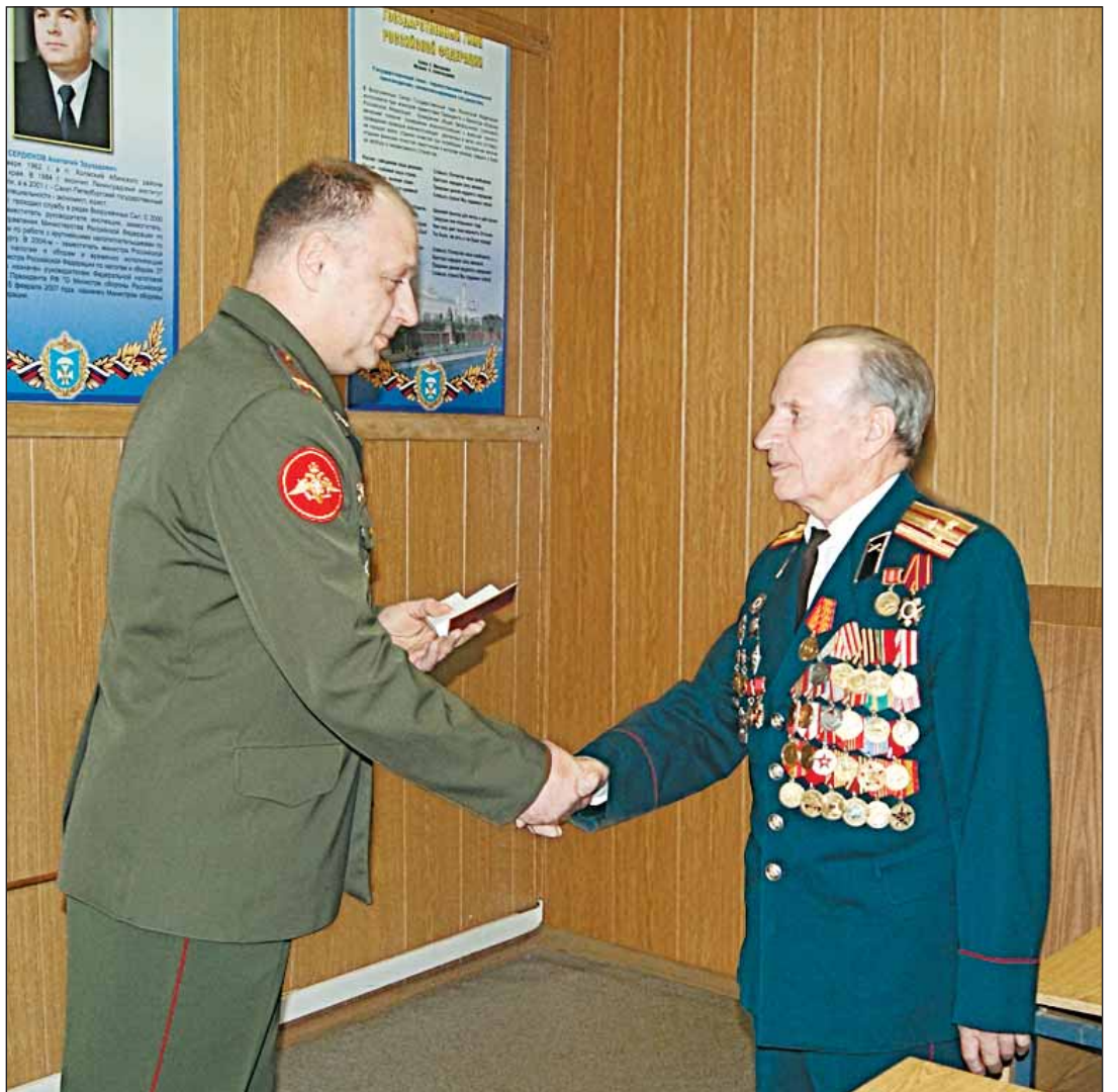
Вручение награды в городском военкомате

В Москве добровольцев распределили по частям. Красноармеец