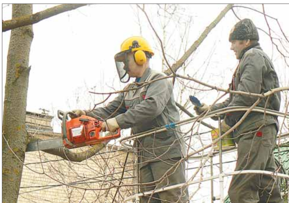
Идёт обрезка деревьев

На сегодняшний день большинство истринских дворов уже очистили от мусора,