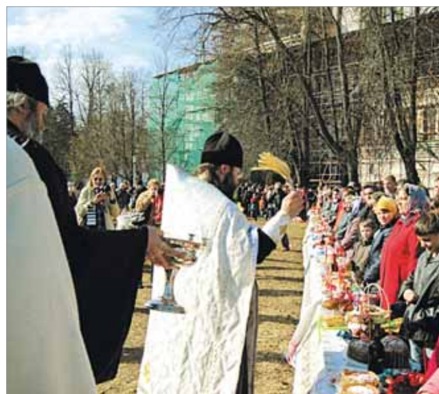
Окропляются святой водой принесенные дары