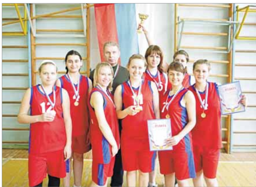
Команда Первомайской школы, победитель соревнований