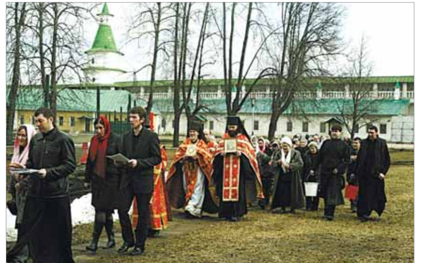
Крестный ход вокруг Собора