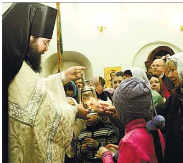
Священный огонь из Иерусалима