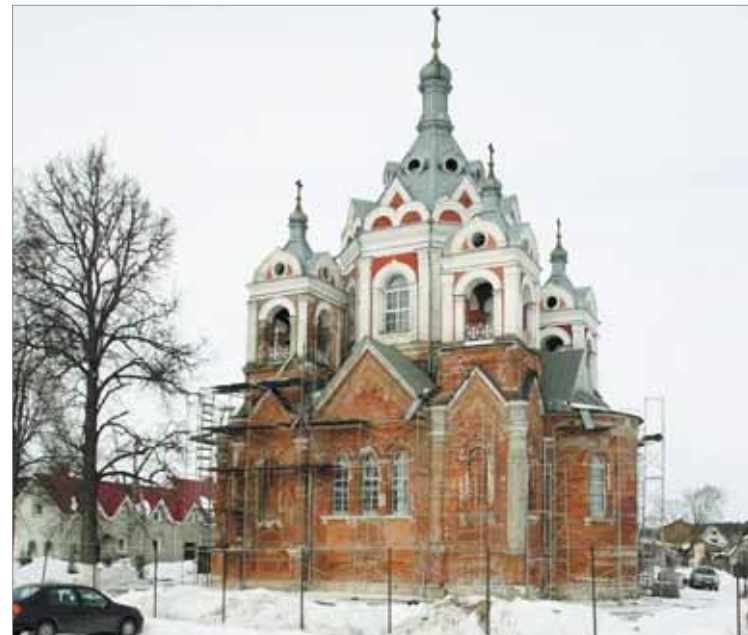
Родовая церковь Казанской иконы Божьей Матери в Глебово, оставшаяся от поместья семьи Шиловских, на средства которых она строилась и где они захоронены

ный золотом и изумрудами. А.С. Даргомыжский бывал в гостях в семье своей ученицы в Глебово. Другой известный композитор, М.П. Мусоргский, гостил в имении Глебово в 1859 и 1860 годах во время своих наездов в Москву. По пути от станции Крюково до Глебова М.П. Мусоргский заезжал в Новоиерусалимский монастырь. В Глебово впервые двадцатилетнему композитору представилась возможность руководить целым хором певчих. Однажды М.П. Мусоргский был даже исцелен водой из местного источника. Его романс «Что вам слова любви» был посвящен хозяйке усадьбы. Также в Глебово