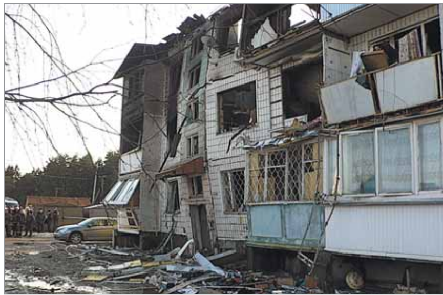
После взрыва в здании произошло несколько обвалов и начался пожар

Когда мы приехали, мужчина был еще жив, и мы направили все силы на то, чтобы не дать огню подойти к нему. От огня мы его спасли, а вот от угарного газа не удалось».