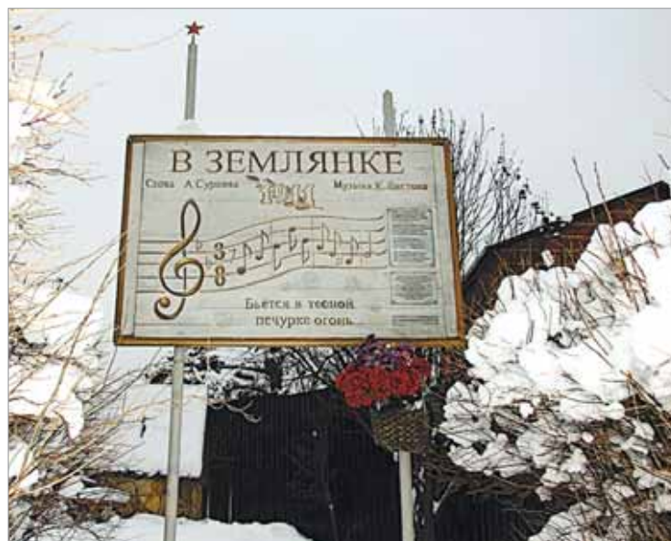
«Землянка» - памятный знак песни А. Суркова «В землянке», который установили ребята из клуба «ИСТОК»