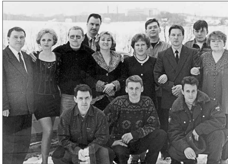
Криминалисты празднуют юбилей службы десять лет назад

Беседовала Елена СОЛДАТОВА, фото автора и из архива отдела ЭКЦ