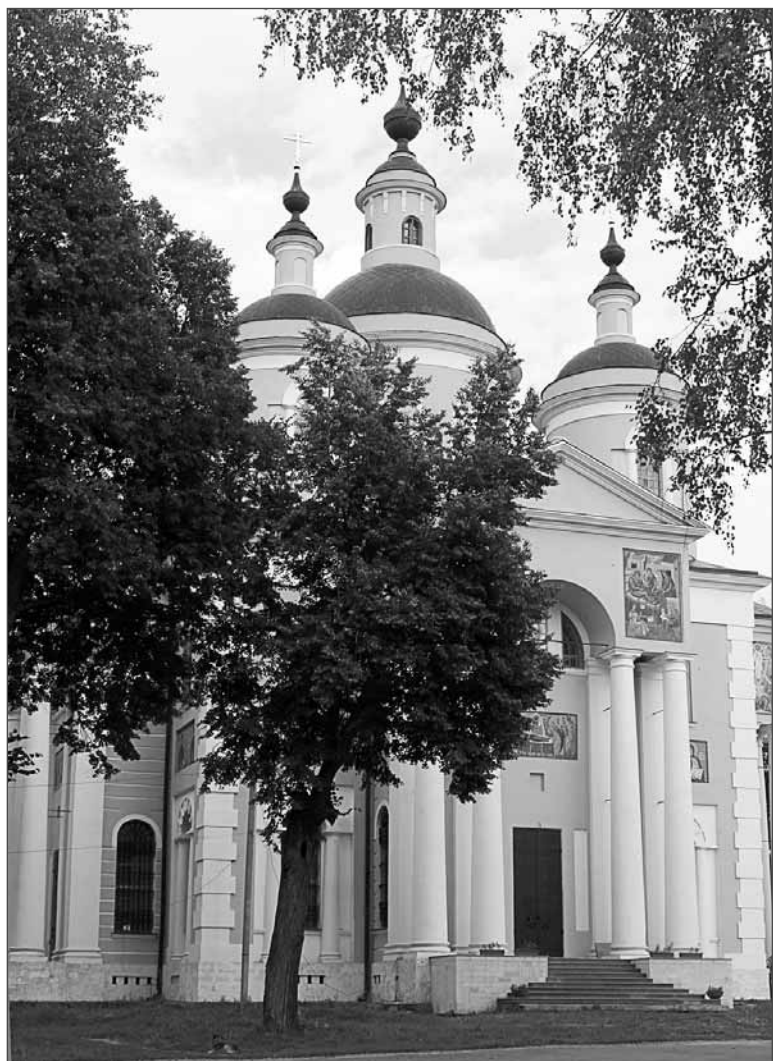
Свято-Успенский Вышенский женский монастырь

(Продолжение следует) Светлана ХОХЛОВА