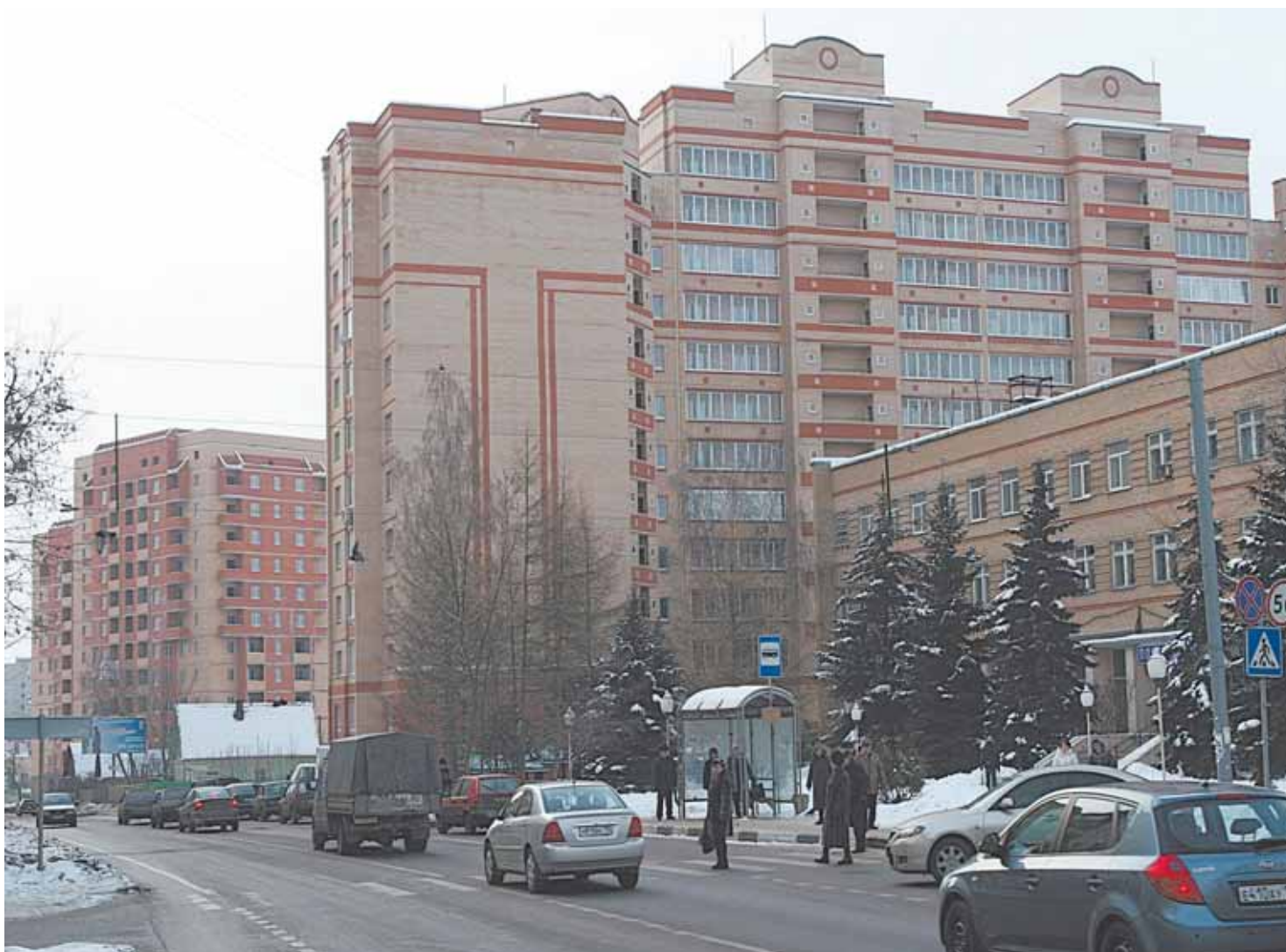
В 2008 году очередники и льготники получили от района 183 квартиры

В районе планируется ввод новых жилых домов