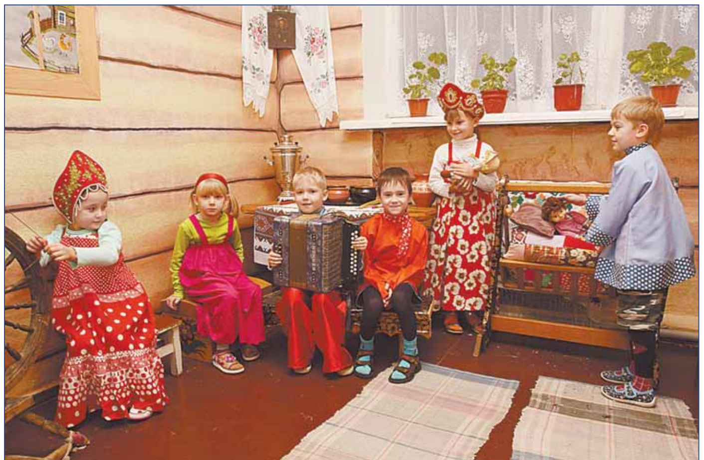
Дети с удовольствием играют в русской избе

Румянцевский детский сад в прошлую пятницу отмечал юбилей