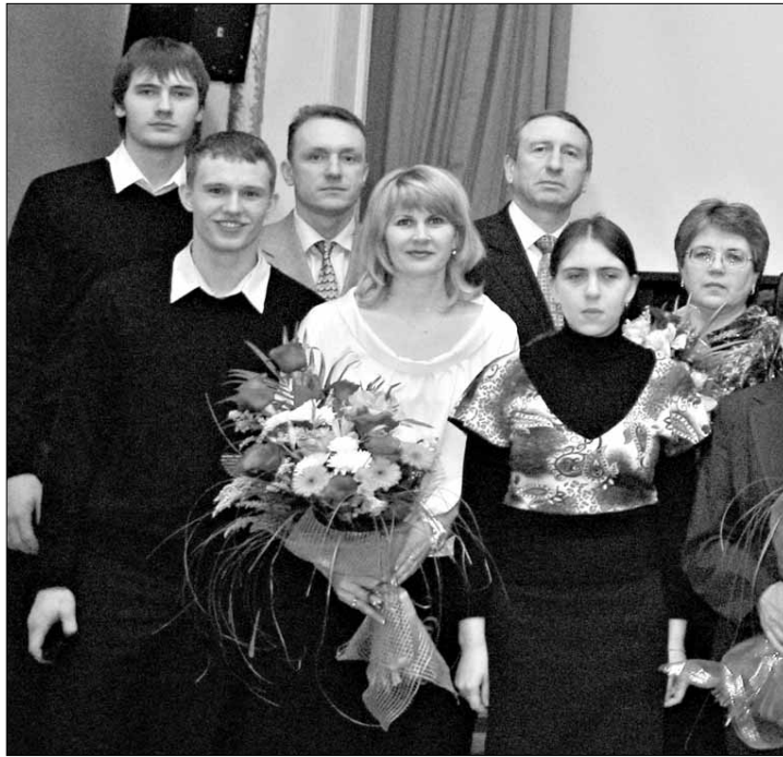
Родители и двое старших сыновей (слева) во время награждения