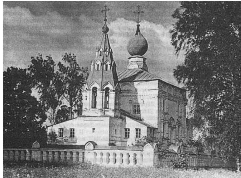
Полевщина. Казанская церковь. Фото начала XX в.

Лев Толстой относил рассказ «Ведьма» к лучшим чеховским рассказам.