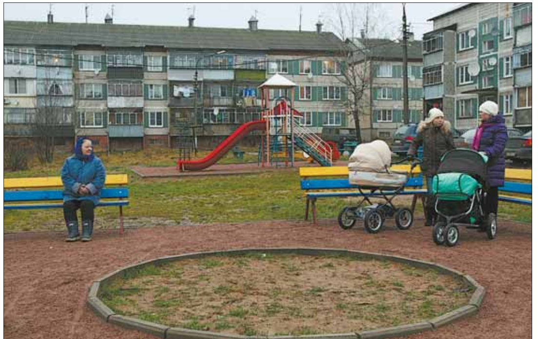
В поселении продолжают обустроить детские площадки

Еще одна статья непредвиденных расходов — замена скульптуры в центре Курсаково. Гипсовая Одиотрия скульптора Казанцева через несколько лет после возведения пошла трещинами — как выяснилось, внутренний раствор скульптуры имеет отличный от гипса коэффициент расширения. Теперь ведутся переговоры с другим мастером, которому поручат установить похожую скульптуру, но из известняка. Из-за более цен-