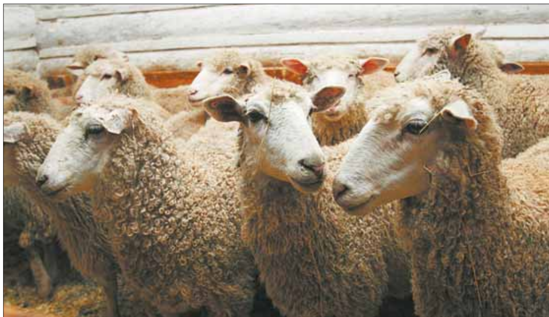
Важное преимущество овцеводства - высокая продуктивность