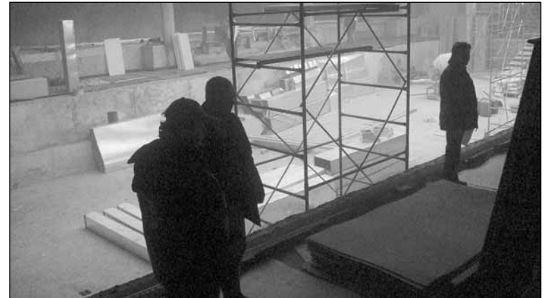
Гостиничный центр «Истра». Чаша бассейна на 4 дорожки

Вопреки непогоде, выкраиваем время и занимаемся благоустройством. На следующей неделе планируем завершить асфальтирование.