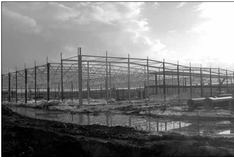
Март - 2008. Будущий корпус GMR-2

Грундфос: В срок закончили асфальтирование территории, примыкающей к новому производственному корпусу.