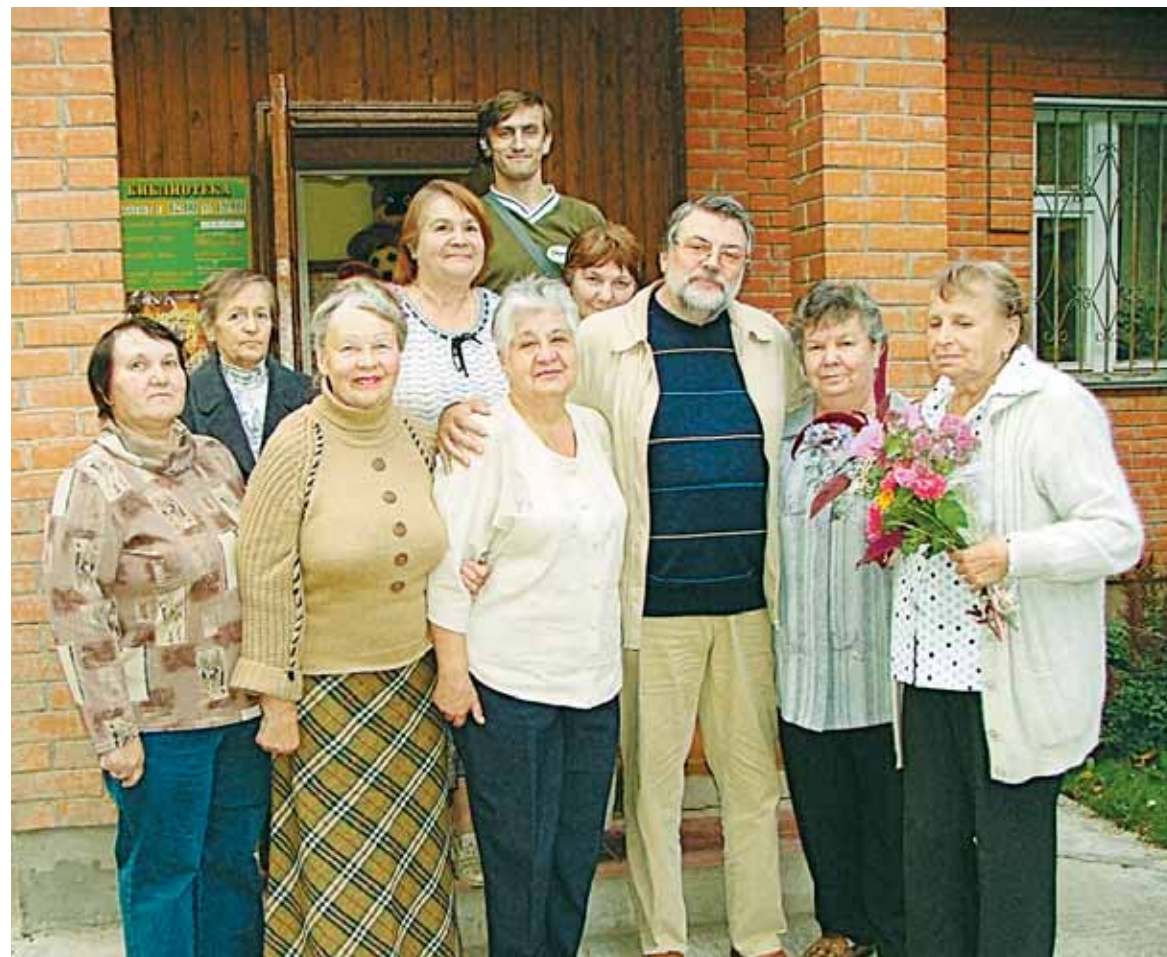
Александр Ширвиндт с читателями Покровско-Рубцовской библиотеки