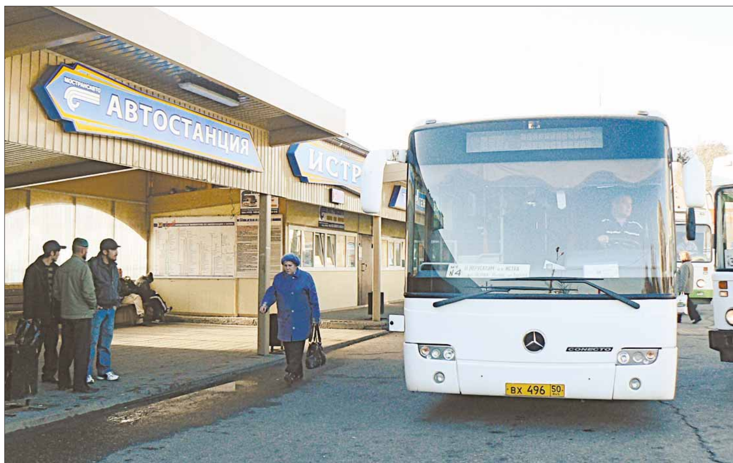
Больше сорока лет Истринское АТП перевозит пассажиров в нашем районе

Традиционные соревнования в преддверии всероссийского Дня автомобилиста истринские автотранспортники проведут в субботу, 24 октября, на площади у нового стадиона в Полево.