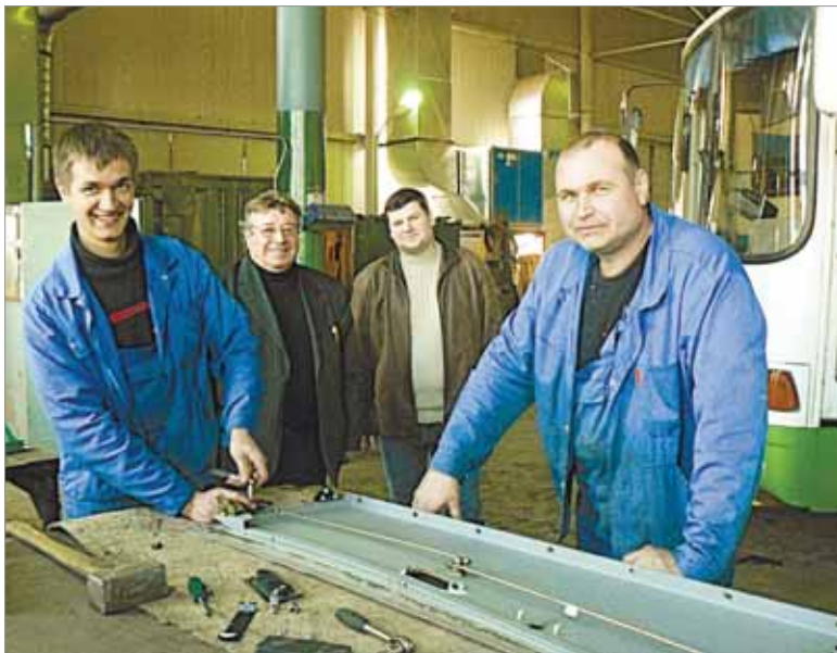
Механики АТП могут починить любую технику

Екатерина КАПРАЛОВА