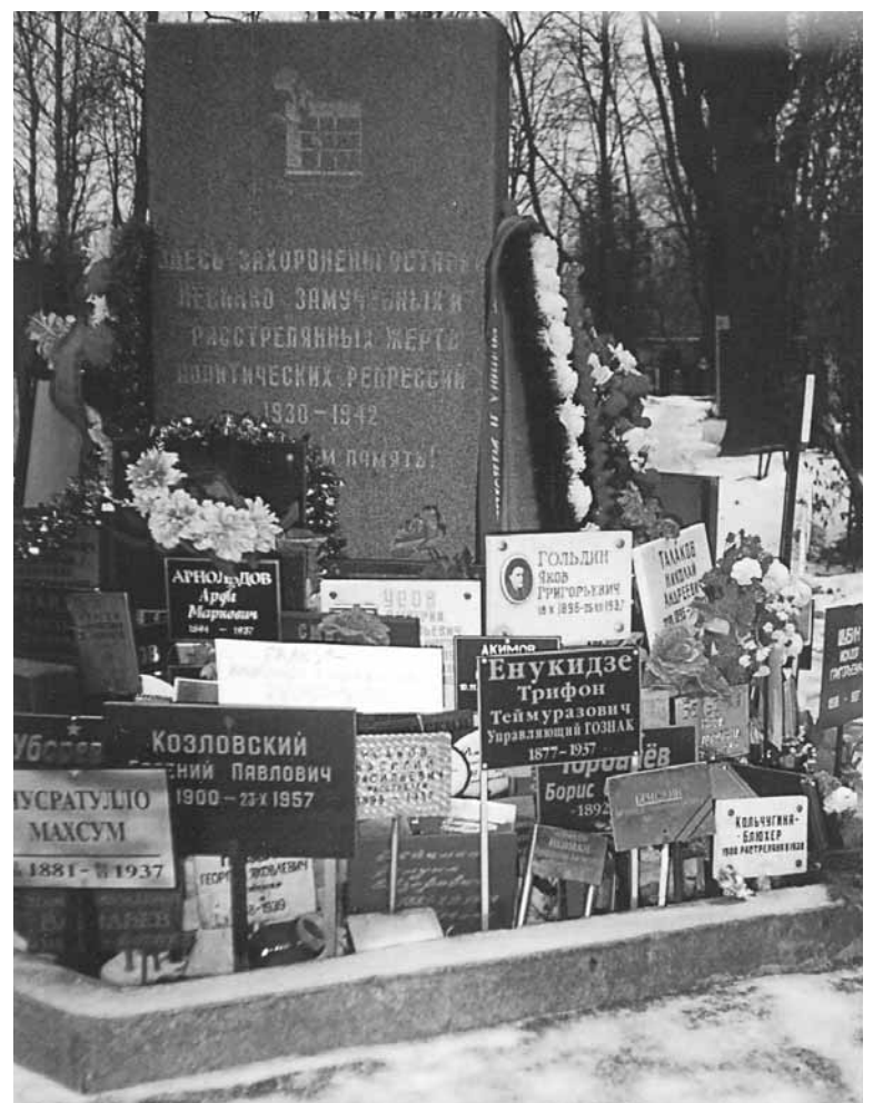
Братская могила репрессированных на Донском кладбище в Москве - место наиболее вероятного захоронения.