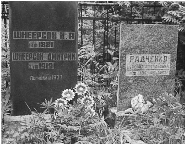
На кладбище в Истре

Современный читатель, знакомый с поворотами социальной истории России, особенно в 30-х и 40-х годах, может представить себе весь ужас и всю несправедливость испытаний, выпавших на долю этой семьи. В подоплёке всех бед лежит тот факт,