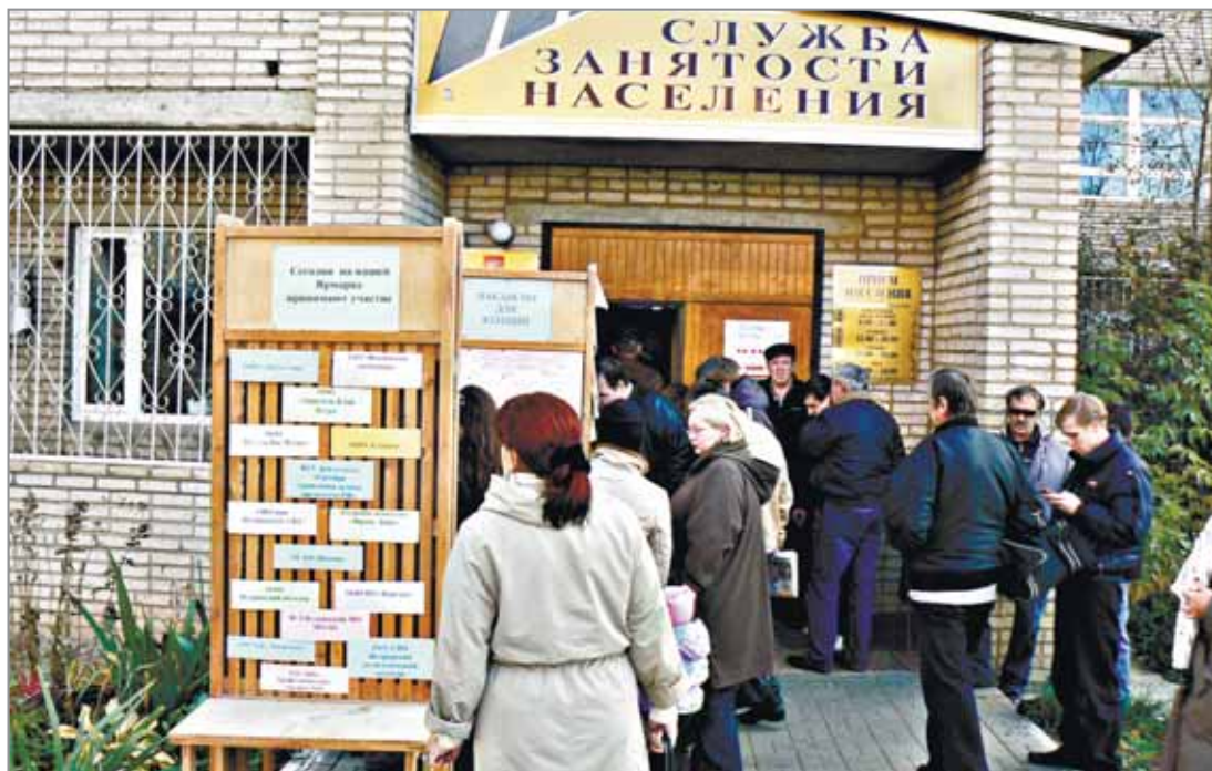
В центре занятости состоялась ярмарка вакансий