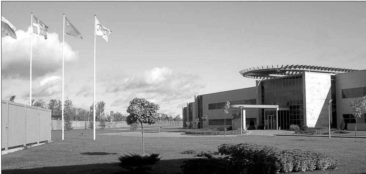
Закончены работы по расширению производственно-складских и офисных корпусов