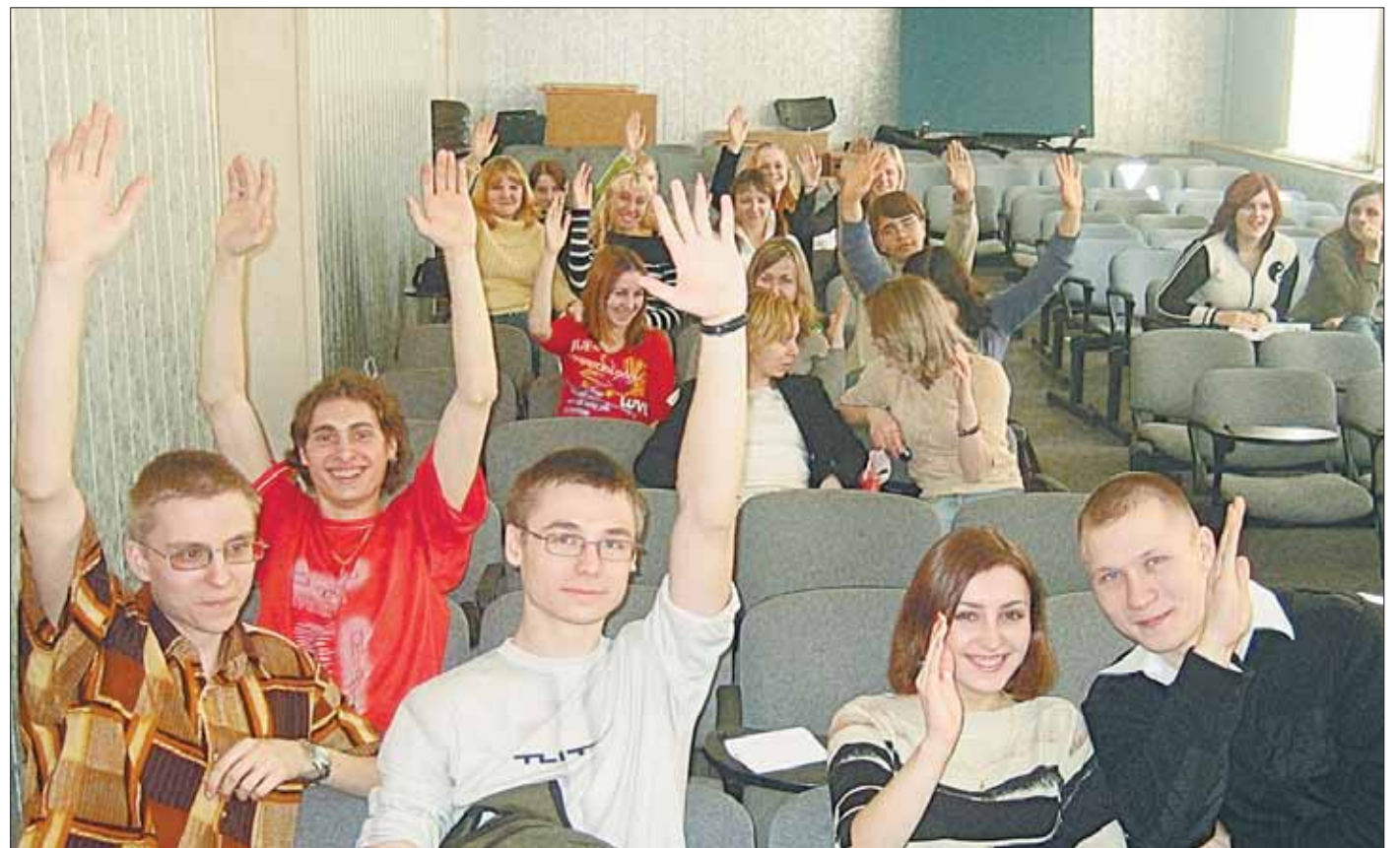
Студенты РГСУ подготовились к выборам 11 октября

В форме деловой игры студенты ознакомились с избирательным правом. Восьмого октября в дедовском филиале РГСУ прошел День молодого избирателя.