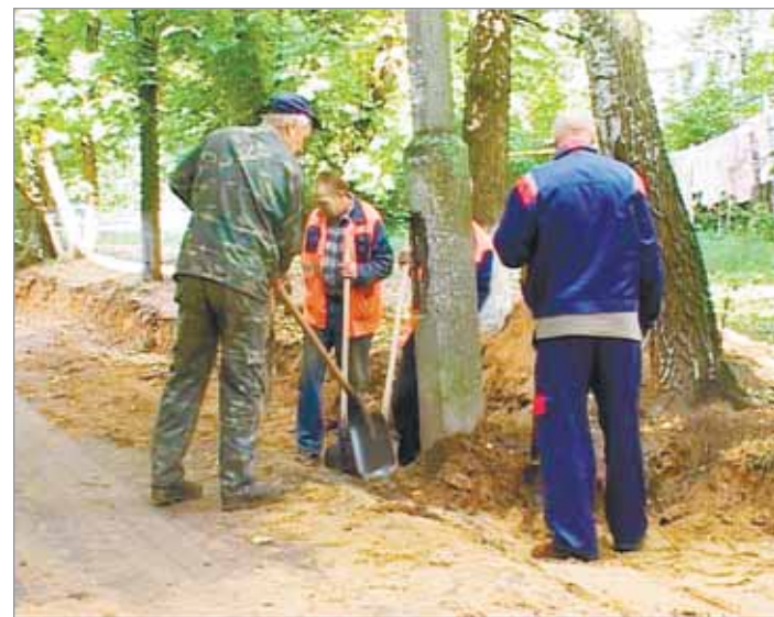
Работы выполняет Истринское ДРСУ