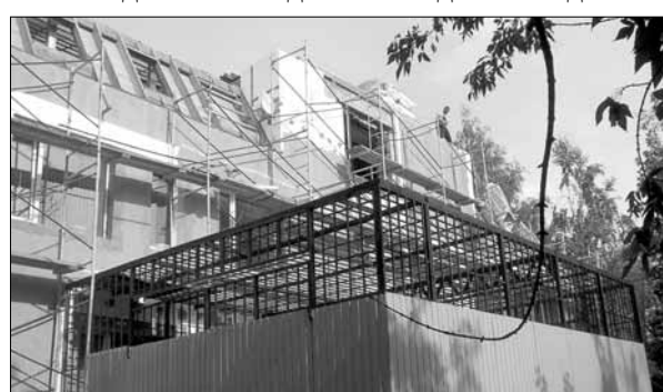
Планы строителей: сдать отремонтированный фасад в первых числах октября

нить, как построить работу и как ее проконтролировать. Прорабам, особенно молодым, проект нужно изучать все-время!!! Сиди и вникай!