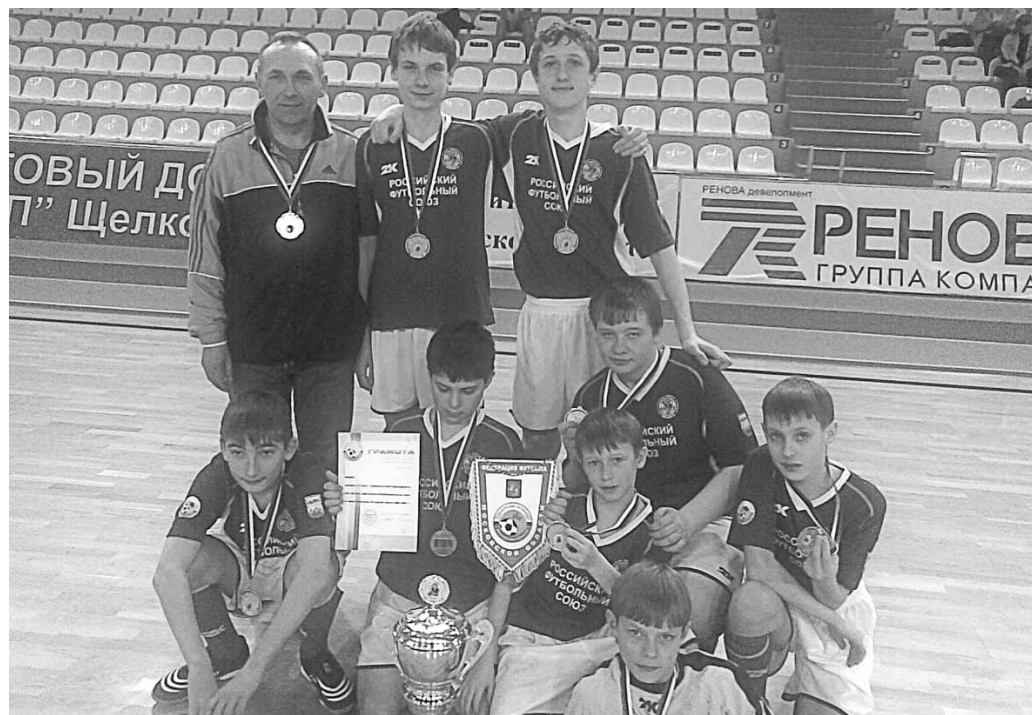
«Глебовец» – бронзовый призёр МО по мини-футболу