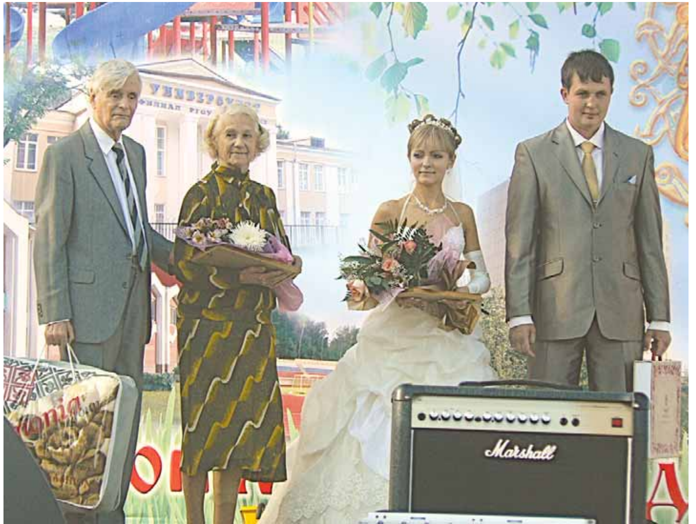
Дедовчане чествовали долгожителей и молодожёнов

Дедовск отметил свой 69-й день рождения пятого сентября