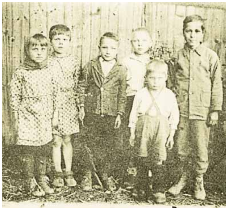
Деревенские ребята послевоенных лет

Подготовила Ирина ОГОРОДНОВА