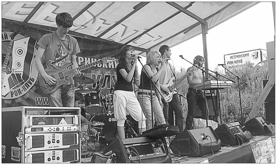
На сцене группа «Лабиринт»

На сцену в эти дни вышли группы, чьи лидеры придумали