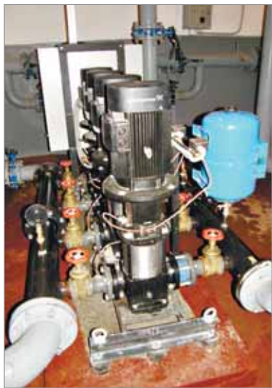
На водозаборном узле установлено самое современное оборудование