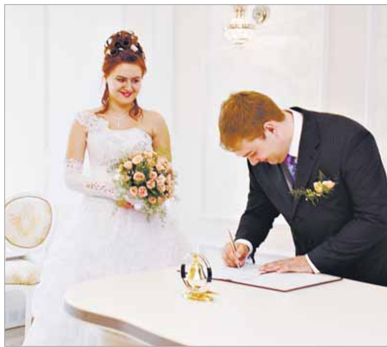
В обновленном зале бракосочетания

Повысилась в сравнении с аналогичным периодом прошлого года рождаемость. С января по июнь в районе родилось 624 малыша — девочек на 18 больше, чем мальчиков — а также в семи семьях появились на свет двойни. Среди самых популярных мужских имен ока-