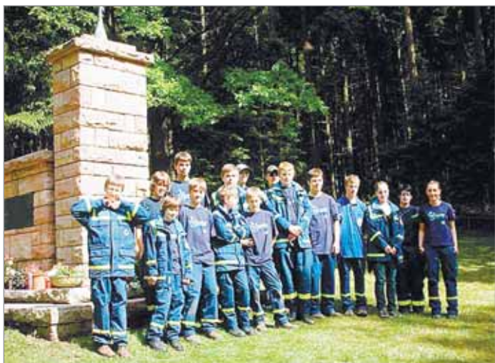
Молодежная организация Бад-Орба рядом с братским захоронением советских воинов

Управление опеки и попечительства Минобразования МО по Истринскому району