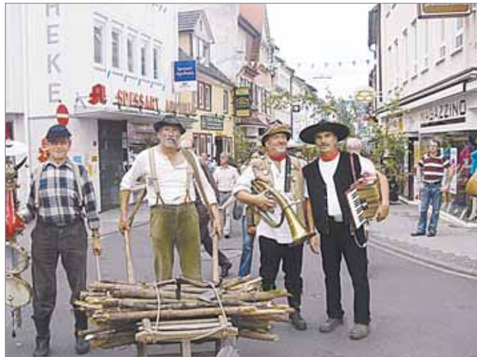
На Дне города жители появлялись в костюмах разных эпох

кузнечных дел мастера. Также горожане демонстрировали ремёсла: как соткать красивую пряжу или сделать вышивку, и даже – как раньше стирали бельё профессиональные прачки: это было очень интересно для маленьких девочек, которые подходили и пробовали стирать бельё на доске, полоסקали его в корыте. Также мне, как специалисту, было интересно наблюдать, как представляла себя реабилитационная Шпессарт-клиника: врачи показывали свою работу: на открытой площадке перед больницей под большими зонтиками разместили кровати, на которых доктор демонстрировали имитацию капельницы, разных видов помощи и так далее, и периодически паровозиком эти кровати проезжали по улицам города. Было весело и интересно. Таким образом люди получали информацию о клинике и о видах помощи, которые там можно получить. Было и театрализованное представление, где сражались друг с другом феодалы рыцари – и это напоминало то, как реконструируют