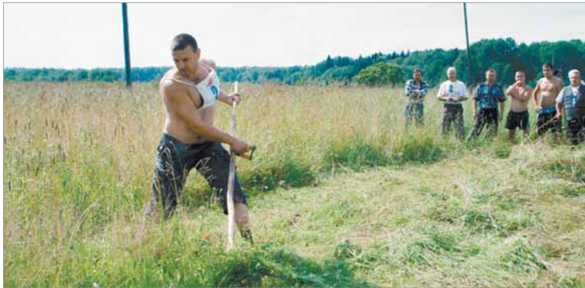
Болельщики, раззадорившись, решили сами стать участниками конкурса

Глядя на работу косарей, становилось понятно, почему такое искон-