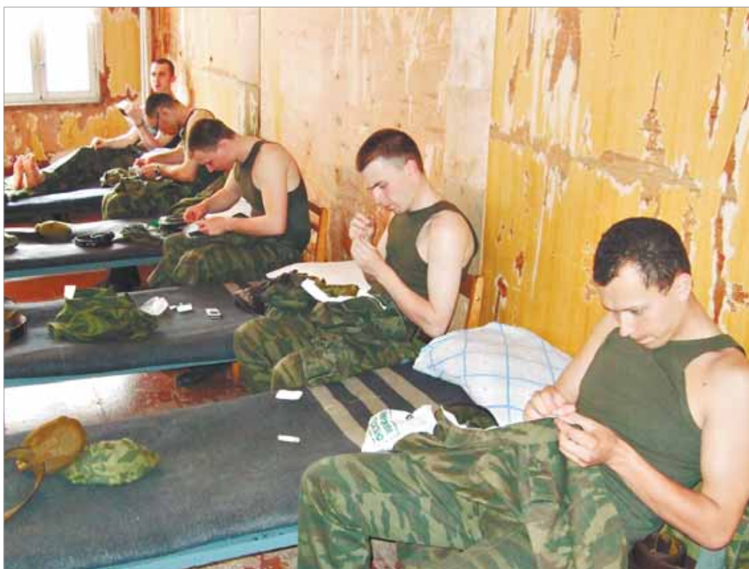
Основная часть новобранцев проходит службу в Московском военном округе