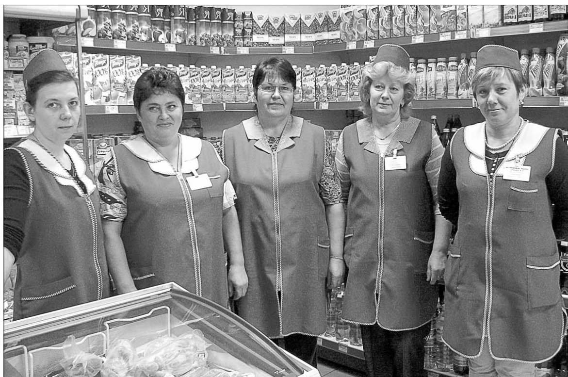
Коллектив магазина №42 в Красновидово