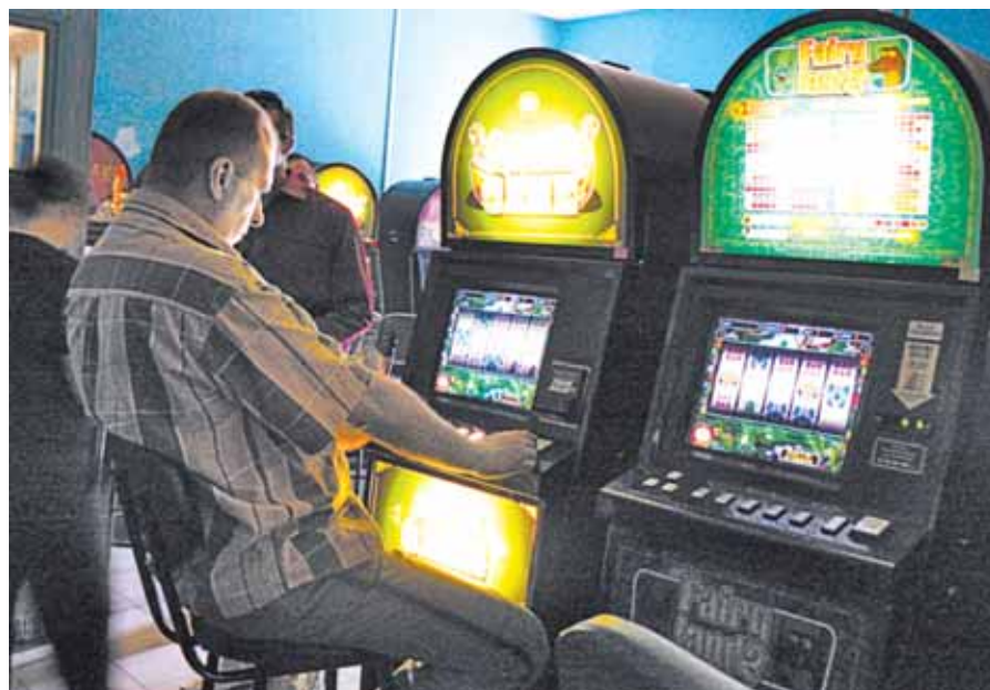
Азартные люди теперь играют на симуляторах

Корреспондент «ИВ» присоединился к рейду по дороге к Павловской Слободе, где до этого дня работали игровые заведения. Как оказалось, предприниматели выполнили требования закона. Двери игрового зала ООО «Селена» по адресу: ул. Свободы, 2А были закрыты. На рынке, который находится на ул. Ленина, 1А, заведение с азартными играми, по