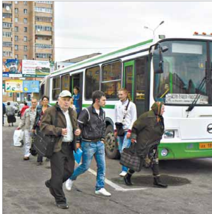
Турникеты на выход вызывают нарекания со стороны пассажиров

— Проблему создают сами пассажиры. Покупают билет до ближайшей остановки, а сами едут дальше. Естественно, на выходе