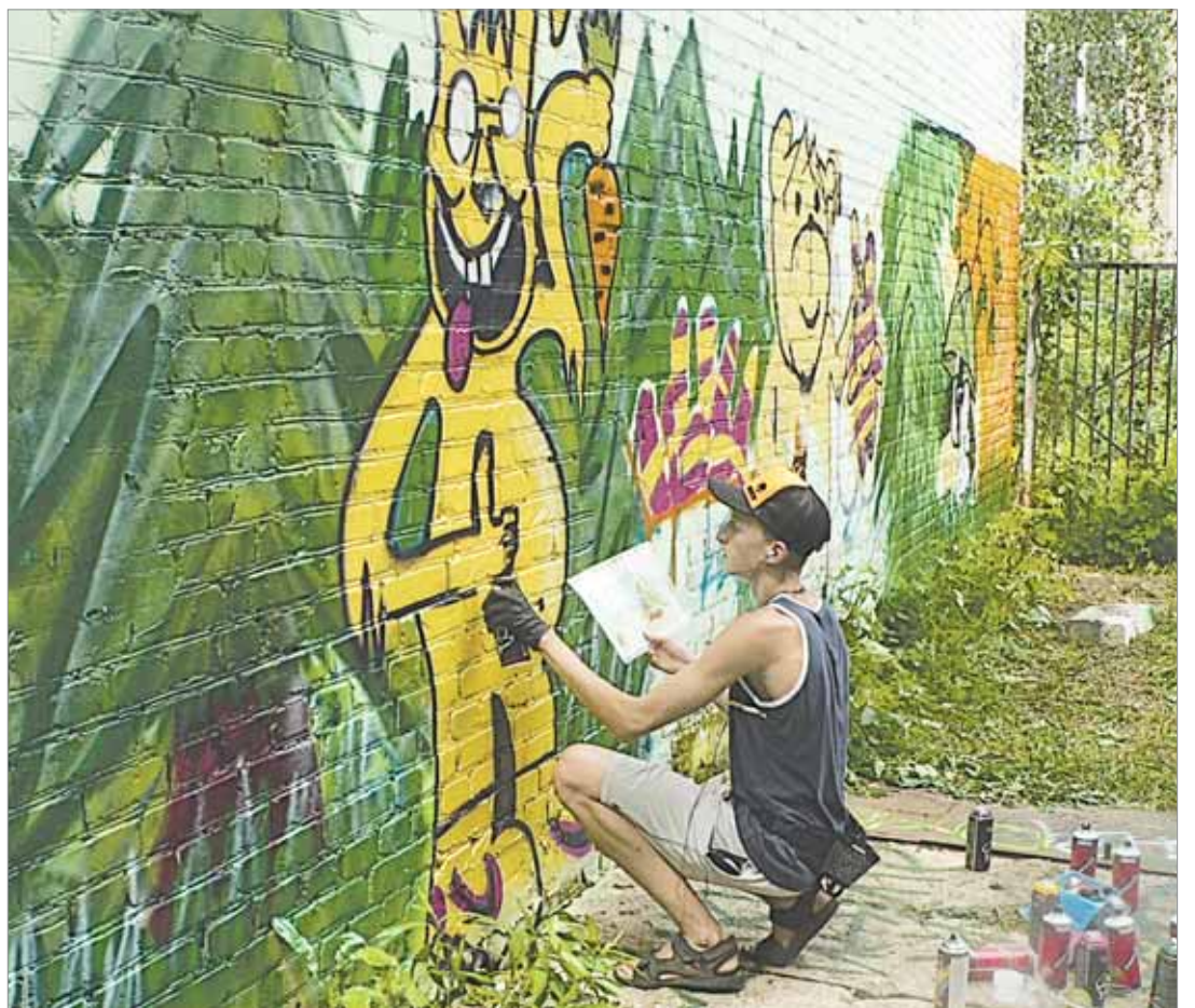
Граффитчики разрисовали стены спортзала на улице Босова

После горячего обсуждения жюри вынесло вердикт. Призовые места и номинации распределились следующим образом: третьего места удостоился «Другой мир», второе заняла группа «Room-12», а первое место получила группа «Flashback». Абсолютными победителями конкурса, завоевав-