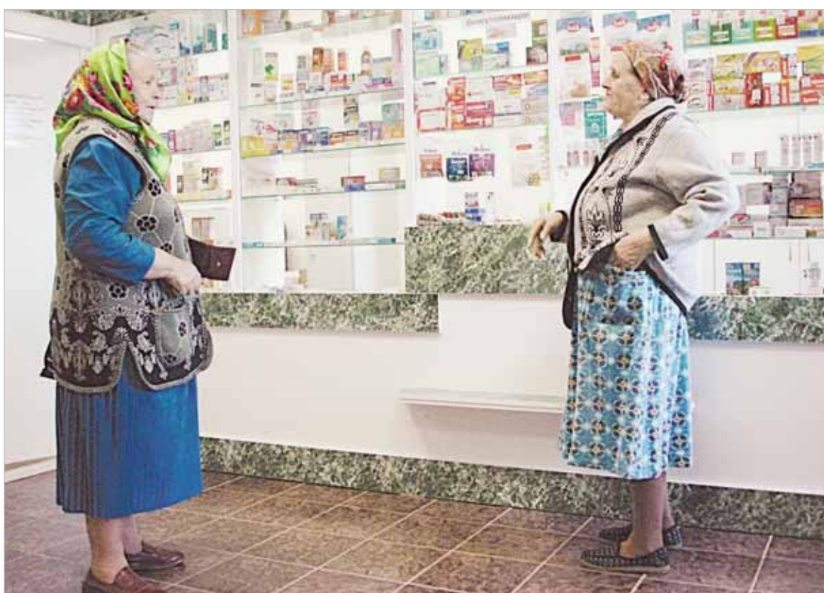
Для старшего поколения в новой аптеке действует система скидок