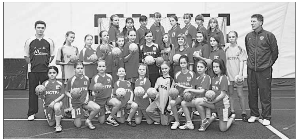
Сильнейшие гандболистки Истринского района

Тренер команды Владимир Дивенко рассказал, что гандбол для Истры молодой вид спорта. Он начал развиваться два года назад, когда губернатор выразил пожелание интенсивно развивать этот вид спорта на территории Московской области. В районе это начинание поддержали учителя физической культуры в школе Павловской Слободы, в Первомайской, Лучинской, а также в Дедовских школах №1 и №3. В Истре гандбол преподают в школе им. Крупской и в лицее.