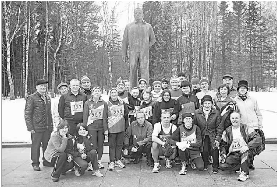
Команда истринских бегунов у памятника Ю. Гагарину

В прошедшее воскресенье команда бегунов Клуба любителей бега «Истра» участвовала в традиционном пробеге памяти первого космонавта Земли Юрия Алексеевича Гагарина. Пробег был дважды юбилейным: сороковым по счёту и посвящённым 75-летию этого знаменитого человека.