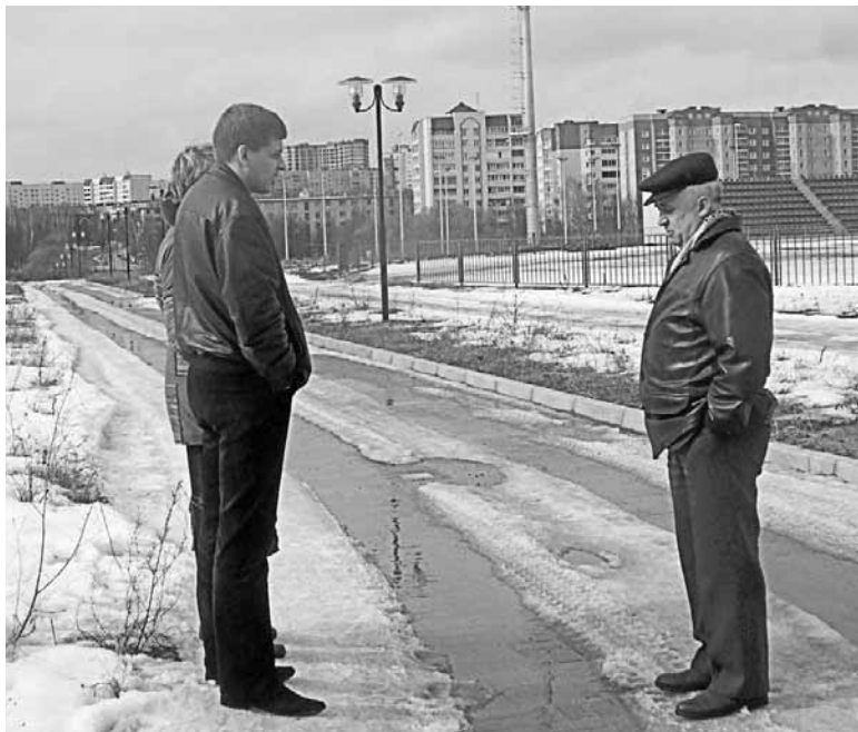
Рабочее обсуждение сметы

ках района, 6 лет в должности чиновника. Что такое отсутствие финансирования в строительстве, он понимает не эмпирически, как, например, кто-то из нас с вами, не строителей, у него за каждой фразой - не только «циферки», а и предельно конкретные знания, сколько оно стоит, дом построить. Свидетельством тому, что заказчик и генподрядчик - по одну сторону баррикад, является уже построенный - на 85% - спортивный комплекс. ОАО «ПСО-13» на линии и сегодня.