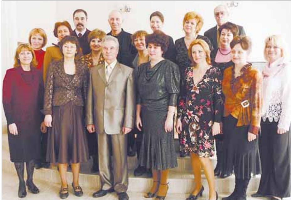
Педагогический коллектив школы

гогов 26 лет. Он рассказал, что со дня основания школу окончили более одной тысячи учащихся, многие из которых стали профессиональными музыкантами. Среди педагогов школы есть и ее бывшие выпускники, которые, получив высшее музыкальное образование,