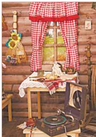
Музей Павловской школы